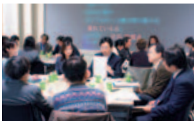
与NACS成员一起举办“CSR报告书阅读会”