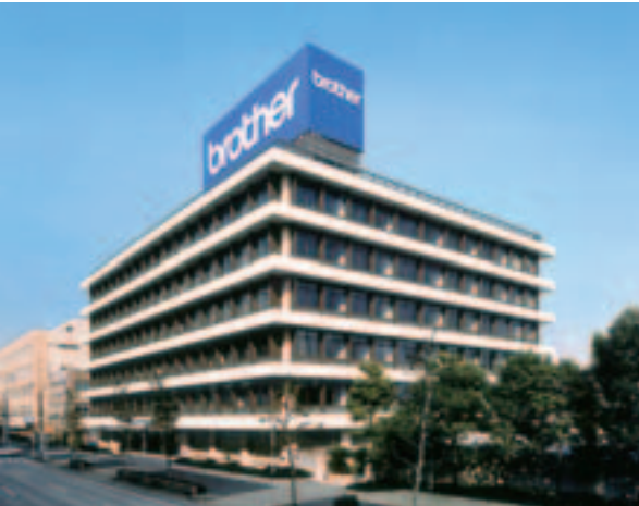
兄弟工业株式会社