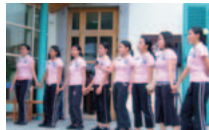
兄弟国际(法国)有限公司支援的“Cameleon Association”活动