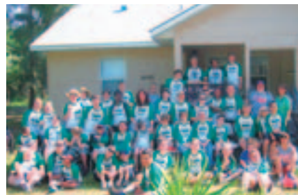
名支援工作人员参加。

兄弟国际(美国)有限公司参加了向非营利组织“The Foundation for Dreams”主办的“梦幻橡树夏令营”捐赠物品的公益活动。兄弟国际(美国)有限公司与服装厂和纺织厂协作，将有漂亮刺绣和喷墨彩印图案的约800件T恤衫等服装捐献给了该夏令营。这是一项援助7~17岁有身体残疾、发育障碍、患有难治之症的儿童和青少年的活动，每年暑假约有250名儿童和青少年以及40~45