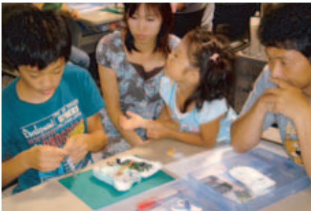
家长和孩子一起组装“P-touch(普贴趣)”的“产品制造教室”

另外，在进行产品修理和生产的三重兄弟精机株式会社，为了让孩子们能在近距离感受作业现场，亲身体验产品制造的乐趣，自2002年起每年都接待小学生前来工厂参观。并在参观过程中安排了很多可以接触Brother产品的机会，让孩子们观察用喷墨多功能一体机印刷照片以及迪斯尼卡通人物刺绣，体验电子图章盖印等。2006年10月，当地的下御系小学共有34名学生来工厂进行了参观体验。