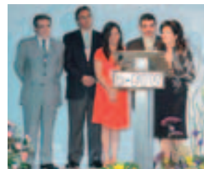
邀请著名设计师参加的颁奖仪式

兄弟国际(墨西哥)有限公司自1996年起开始为“Brother时装国际展”提供后援支持。这项活动既为学习服装设计的学生们提供了发表作品的舞台，同时也是向世界推广缝制及刺绣技术的好机会。学生们按照自己设计的图案，用Brother的产品进行制作，然后以服装表演的形式发表作品。对学生们来讲，该活动是向专业设计师跃进的机会之一。2006年5月举行的大会上，共有113所学校的约500名学生代表参加，3天中有约1,800名有关人员观赏了服装表演。兄弟国际(墨西哥)有限公司对学生们进行了缝纫机操作和刺绣技术的指导，并组织研修，还对整个大会的运营给予了支持。