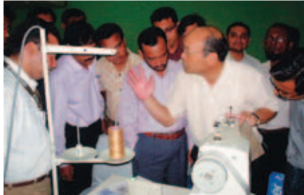
通过实际接触各种机器，学习掌握技术(孟加拉)