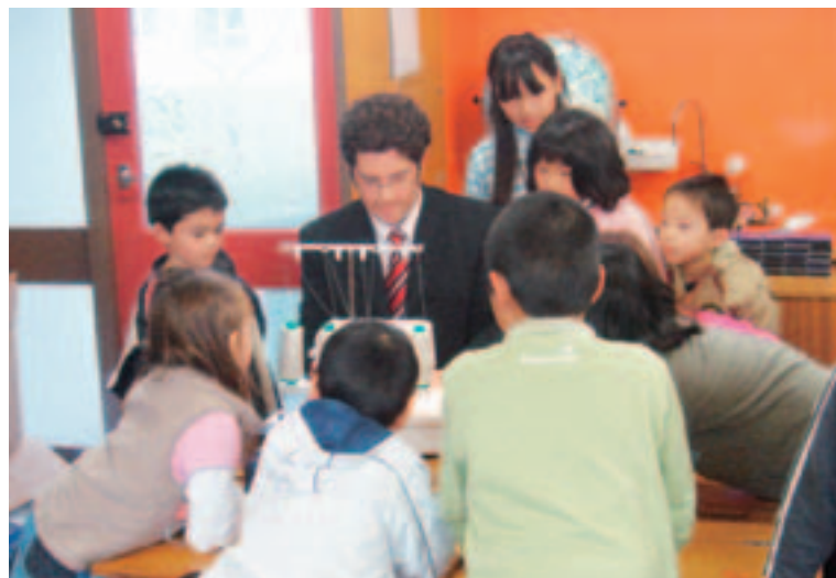
新西兰的缝制教室

大部分孩子都是第一次接触缝纫机，我们使用可简单进行卡通形象刺绣的缝纫机以及可利用电脑、互联网享受缝纫乐趣的缝纫机等进行讲解。如今，在家庭里接触手布制品的机会越来越少，开办这样的教室给孩子们提供了传达创作乐趣的好机会。