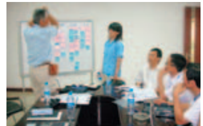
相互交流创意构思的“后期合作活动”

Brother集团在各生产基地，为促进供应商技术水平的提高，开展了各种各样的支援活动。珠海兄弟工业有限公司导入了针对零件供应商的“评价系统”，制定了有关质量、成本、交货期的15项评价标准，并设定了三个等级。每月公开其结果，以便于供应商间的互相学习。兄弟工业技术(马来西亚)有限公司自2006年4月起，开始实施支援零件供应商改善质量检查程序的计划项目。通过该计划项目，来提高供应商的质量检查能力和产品知识，建立起可保证更高质量零件的体制。