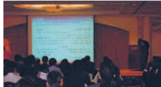
在广东省深圳市举办的“2007年度方针说明会”

不仅是传达信息，为了回应合作伙伴的要求，P&H分社还在日本和美国以销售代理店为对象实施了满意度调查，并把调查结果反映到各种措施中。2006年度，根据美国的调查结果，我们实施了缩短向销售代理店运送产品的时间，削减捆包材料等措施，通过这些改善活动，提高了物流工作的满意度。