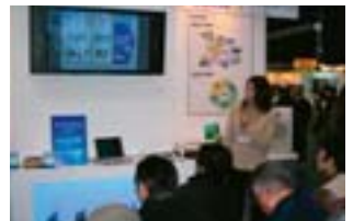
在“2006年关西野村资产管理展览会”上举办企业说明会

有的参观者谈了他们的感想，“以前一直以为Brother是生产缝纫机的厂家，看了展览才知道，原来现在的主要产品竟是信息通信设备”。通过展览，使更多的人加深了对Brother集团的了解。