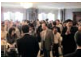
股东大会结束后，Brother与很多股东加深了联谊

2005年度，为了能使更多的股东前来参加“定期股东大会”，我们将会场由原来的兄弟工业总部改为交通方便的名古屋站附近酒店。会场里除展示Brother产品以及环境活动介绍外，还举办了由企业领导与股东参加的恳谈会，这些举措大大增进了Brother集团与股东间的交流。