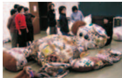
⑤ “日本拼贴布网络”制作生态泰迪熊的情景