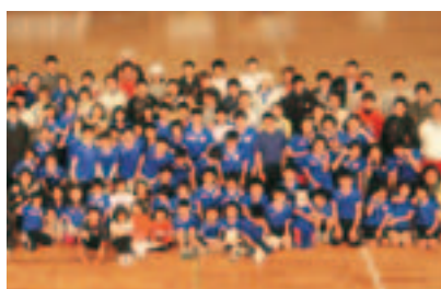
⑩ “名古屋体育俱乐部”手球部的活动