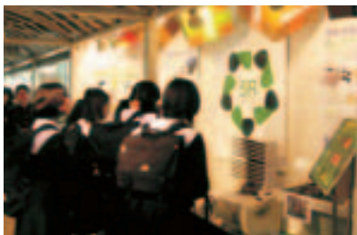
① 瑞穗工厂生态旅游