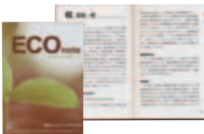
④ 环境用语词典“2003年版生态笔记”