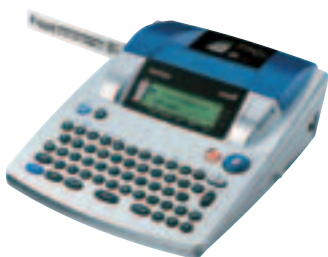
被英国皇家盲人协会认定为视觉障碍者推荐产品的电子标签机 P-touch3600

另外，2003年9月30日与10月1日二天，在英国召开了“TEC Live 2003”。“在英国，Brother 标签机 P-touch3600 的 无障碍设计 （►P19）受到了认可，被认定为视力残疾人推荐产品。象这样宣传集团的社会责任活动情况是我们的目的之一，同时还注重以各种形式向英国顾客提供环境、IT 技术等方面的广泛信息，并与大家积极交换意见。”（兄弟国际（英国）前社长·铃木博）。正如铃木前社长所说，在“TEC Live 2003”上，英国贸易工业部负责人、欧盟有关 WEEE·RoHS 新环境法规 （►P35）的制定人员、瑞典专业雇员联盟（TCO）负责人等就环境技术、英国及欧洲的环境法规动向等，以更意识本地情况的主题进行了演讲和问答。德国也举行了同样的活动。