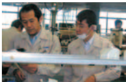
⑨ 组装线上的就业实践