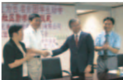
⑦ 兄弟缝纫设备（上海）有限公司助学金捐赠仪式

兄弟国际（德国）有限公司在2003年度再次参展了欧洲最大规模的商业展“CeBIT”。展会上展示了Brother集团各种主力产品与新产品，同时举行了赠送Brother产品的猜迷大会等让孩子与成人都感兴趣的各种活动。展区参观者络绎不绝，气氛十分活跃（▶ 照片⑫）。