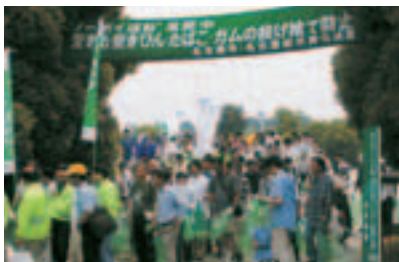
③ 作为 EPOC 活动的一个环节，参加“2003 名古屋清洁运动”